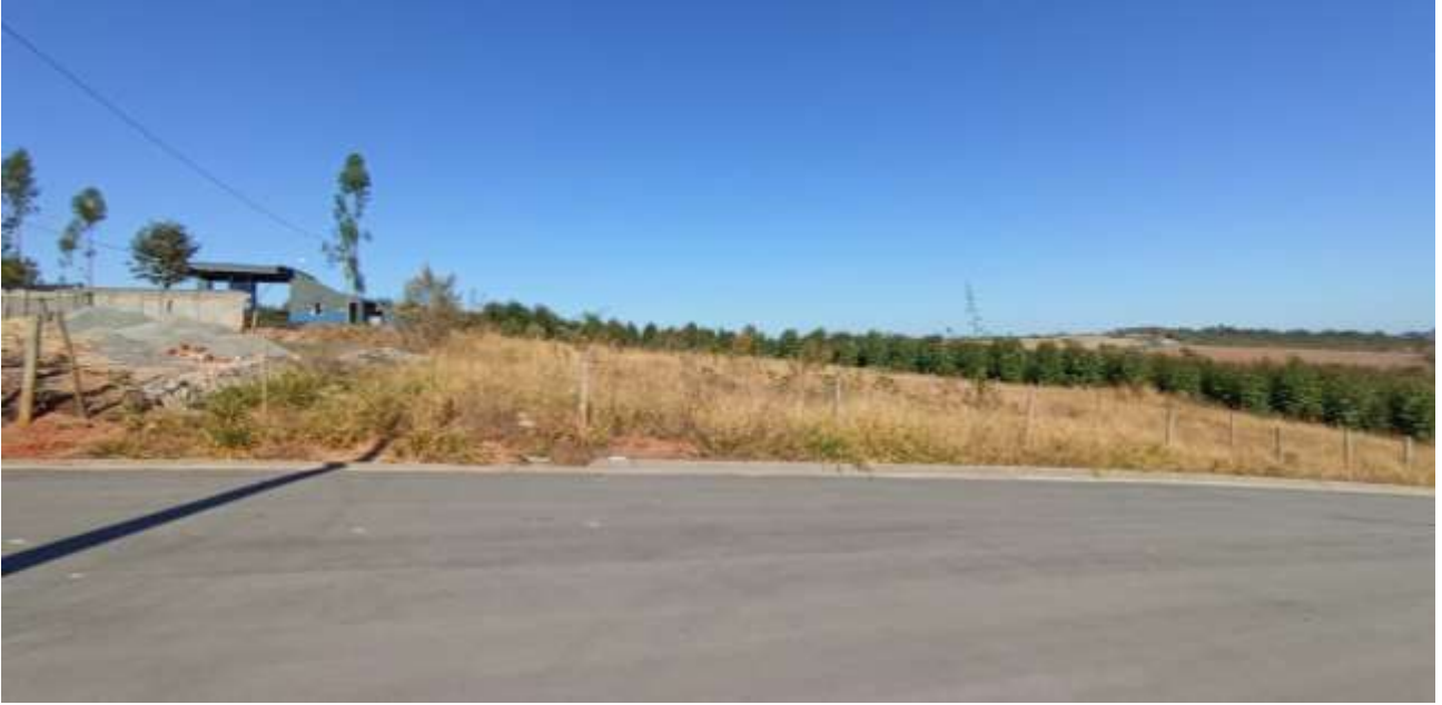
Imagem 05: Terreno vistoriado.

PREFEITURA MUNICIPAL DE CEDRO DO ABAETÉ ESTADO DE MINAS GERAIS CNPJ: 18.296.657/0001-03