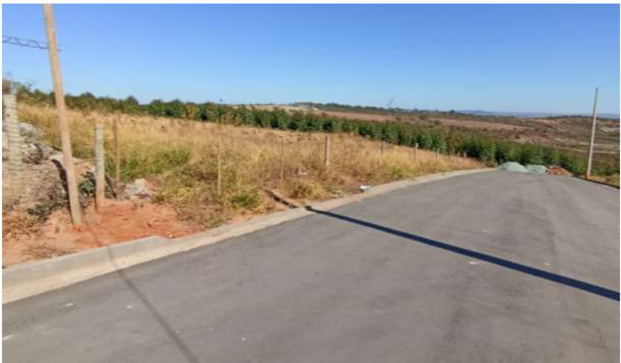
Imagem 04: Rua B, entrada do terreno a esquerda.