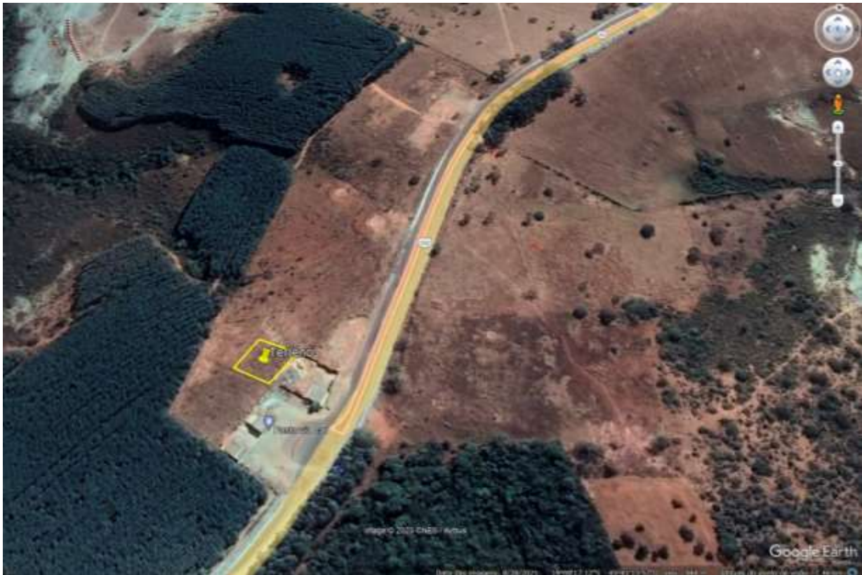
Imagem 01: Croqui de localização.