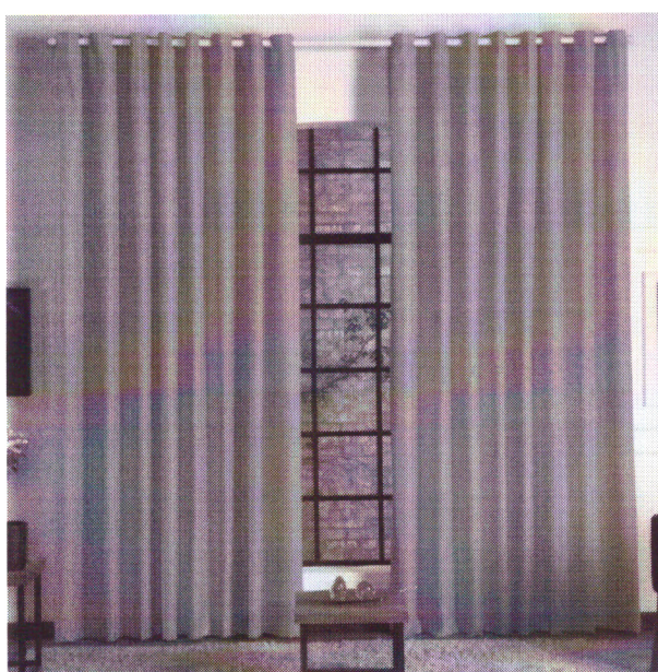
Figura 1 - Imagem ilustrativa.

2.5 Foi acrescido o dobro de tecido à dimensão horizontal das cortinas, considerando que serão instaladas de forma que o tecido fique franzido, conforme imagem abaixo.